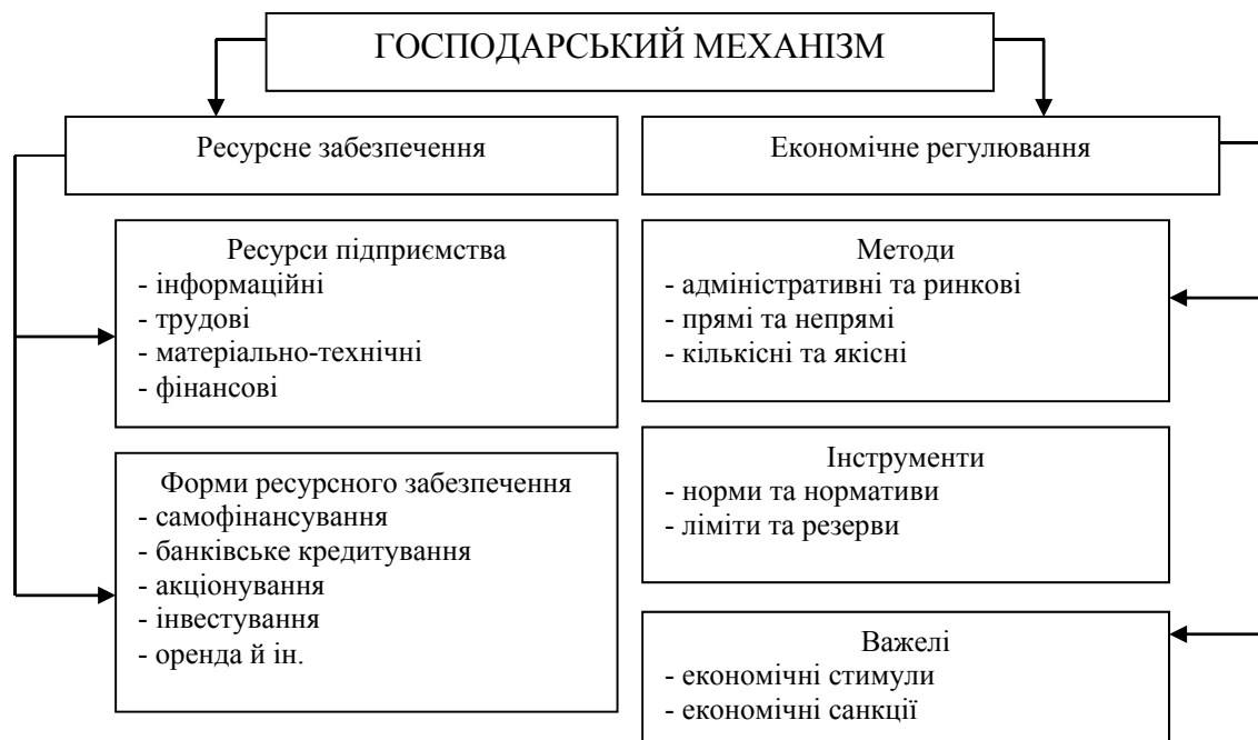
Рис. 2. Внутрішня структура господарського механізму СЕС (розробка автора)

Аналізуючи діяльність підприємства як основного господарюючого суб'єкта ринкової економіки, Н. В. Афанасьєв, В. Д. Рогожин і В. І. Рудика ототожнюють поняття «господарський механізм» і «господарський механізм управління», розуміючи під ним «... цілісну систему, яка складається зі взаємопов'язаних підсистем: критерії управління й оцінювання персоналу; елементи об'єкта управління, на які здійснюються дії (чинники управління); ресурси і стимули, за допомогою яких здійснюється дія; методи розрахунку й ухвалення управлінських дій» [3]. Вищезгаданими авторами підкреслюється системний характер господарського механізму управління, а також можливість формування стійких конфігурацій (шаблонів) вирішення завдань у процесі стабільного функціонування підприємства та СЕС у цілому.