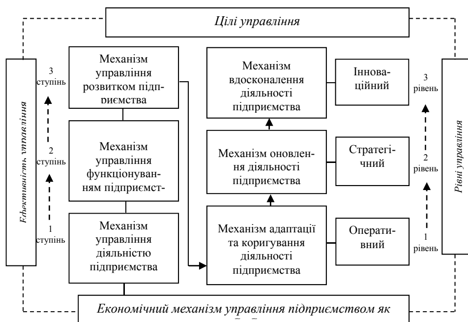
Рис. 3. Місце механізму управління розвитком підприємства в економічному механізмі управління підприємством і його еволюційні форми (розробка автора)

Узагальнюючи вищесказане, слід зазначити, що механізм управління розвитком підприємства як СЕС проходить у своєму розвитку три стадії еволюції (набуває три еволюційні форми): механізм адаптації та коректування діяльності підприємства до змін економічного, соціально-демографічного та політичного середовища, а також коливань на світовому, національному, регіональному та галузевому ринках; механізм оновлення, що припускає розширене відтворення на інноваційній основі техніки, технології, організації й управління підприємством; механізм вдосконалення, що передбачає, з одного боку, ліквідацію диспропорцій, що існують на підприємстві, і суперечностей, а з іншої – створення нових диспропорцій і суперечностей як джерел подальшого розвитку. Саме цим механізм управління розвитком відрізняється від механізму управління функціонуванням підприємства (рис. 3).