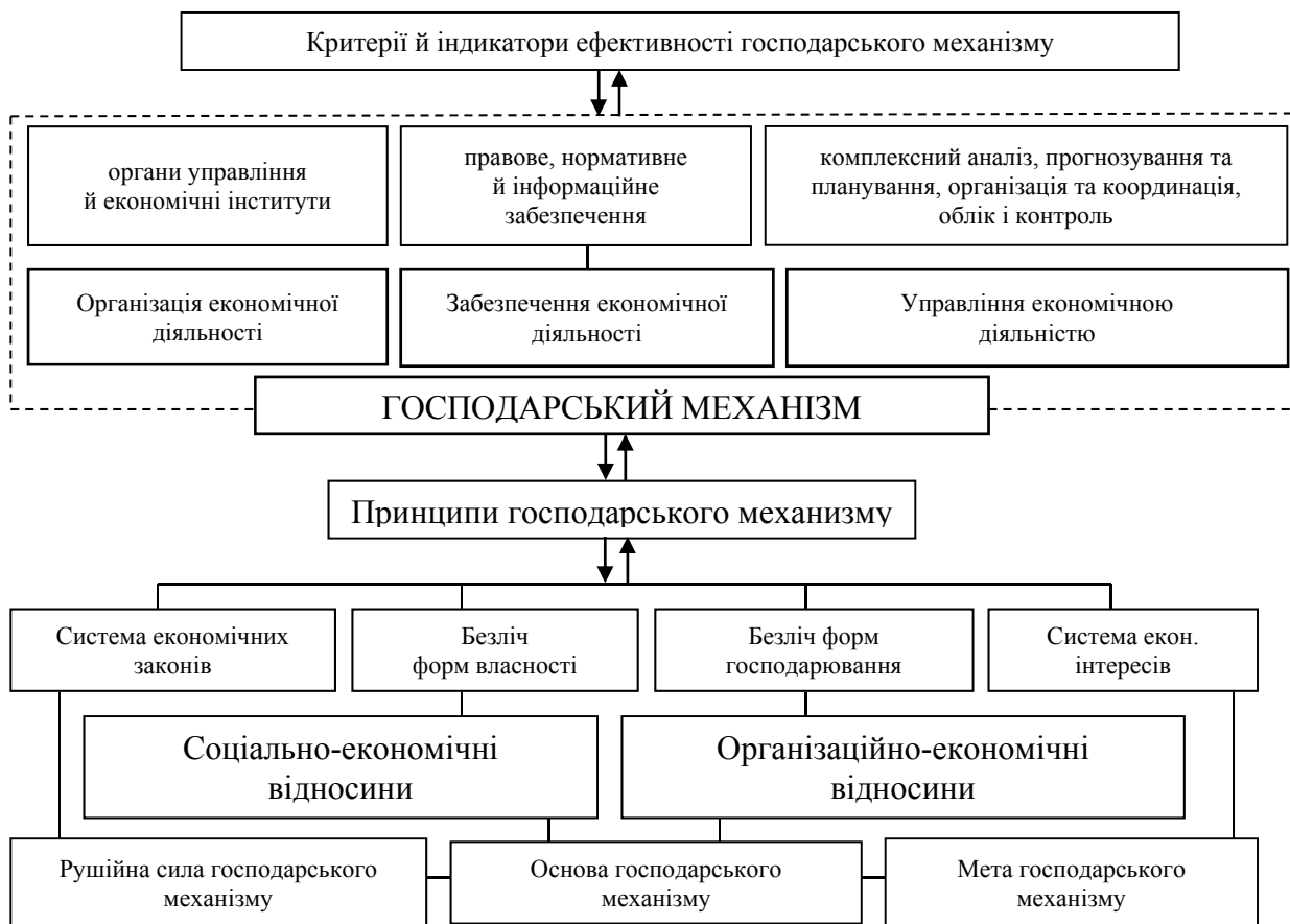
Рис. 1. Організаційна структура господарського механізму СЕС (розробка автора)

В умовах ринку поняття «господарський механізм» повинне враховувати такі важливі аспекти, як конкуренцію й економічну лібералізацію, тобто атрибути, властиві саме ринковій системі господарювання. [2].